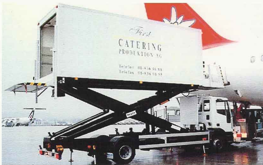
Edelweiss Air zählt zu den wichtigen Kunden von First Catering.

Falsch. Für einmal geht die Gleichung zur grossen Überraschung nicht auf: Balair gleich SAirLines, SAirLines gleich SAirGroup, SAirGroup gleich SAirRelations und SAirRelations gleich Gate Gourmet. Will heissen, dass, weil alles unter einem Gruppendach «produziert» wird, der Balair-Passagier auf dem Flug in die schönsten Tage des Jahres – wie könnte es anders sein – mit Catering aus der Küche von Gate Gourmet gepflegt wird.