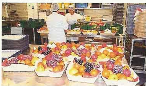
Früchte sind ein wichtiger Teil der Verpflegung.

etwa einen eingeschränkten Bewegungsradius auf, und er verlangt auch eine höhere Mobilität gegenüber den Kunden. Dennoch überwiegen die Vorteile deutlich. Sogar so klar, dass vor einem Jahr im Nebenhause neue Räumlichkeiten bezogen werden konnten und sich die Produktionsfläche von anfangs 1000 auf heute 3000 Quadratmeter erhöhte. Gleichzeitig erfolgte die Einrichtung einer heissen Küche nach neusten EDV-Erkenntnissen. Diese erlaubt es nun, alles in eigener Regie, also «inhouse», zu produzieren. Angesichts der zunehmenden Kundenvielfalt, welche eine breitere Angebotspalette sowie einen hohen Flexibilitätsgrad erfordere, habe sich ein Ausbau der Infrastruktur aufgedrängt. «Gegenüber unseren Kunden ist nun ein viel höherer Aktionsradius gewährleistet», blickt Oberholzer zufrieden auf die getätigten Investitionen.